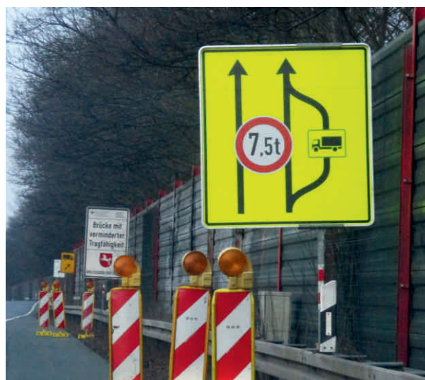
Gute Erkennbarkeit der gelben Folie.