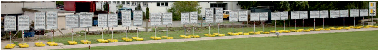
1.600 x 1.220 mm

Verkehrsinformationen müssen bei der Vorbeifahrt in ca. 3 Sekunden eindeutig begreifbar sein . Es ist Mittelschrift entsprechend DIN 1451 mit einer Mindestschriftgröße von 140 mm zu verwenden.