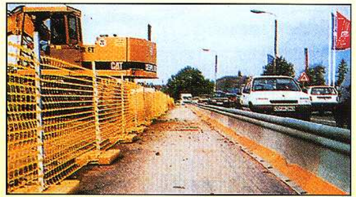
Sicherung von Fußgängern zur Baustelle und zum Kraftverkehr