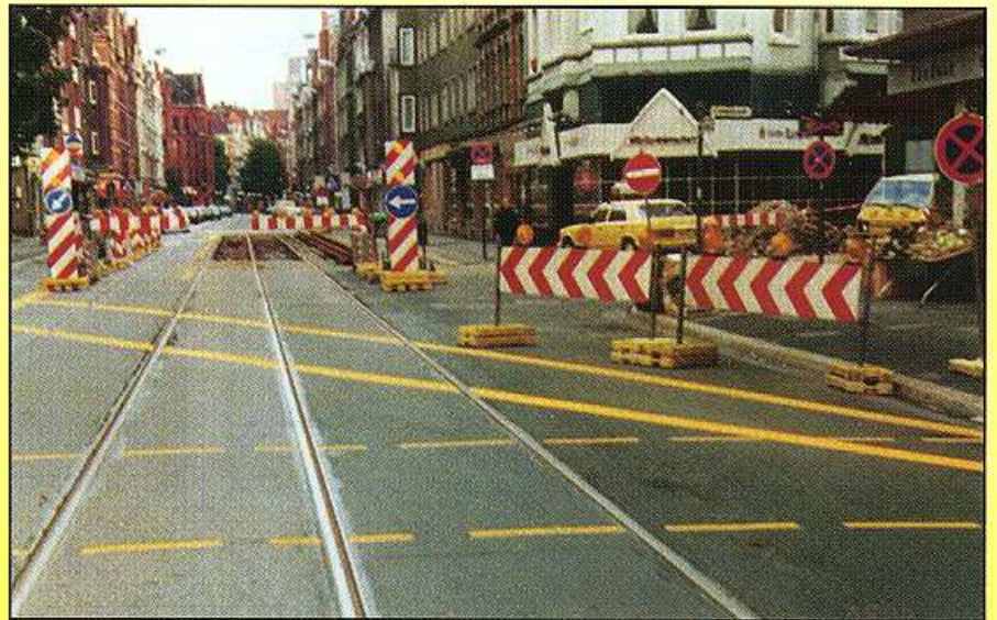
Verschwenkung des Kfz-Verkehrs auf die Gegenfahrbahn mit Richtungswechselverkehr